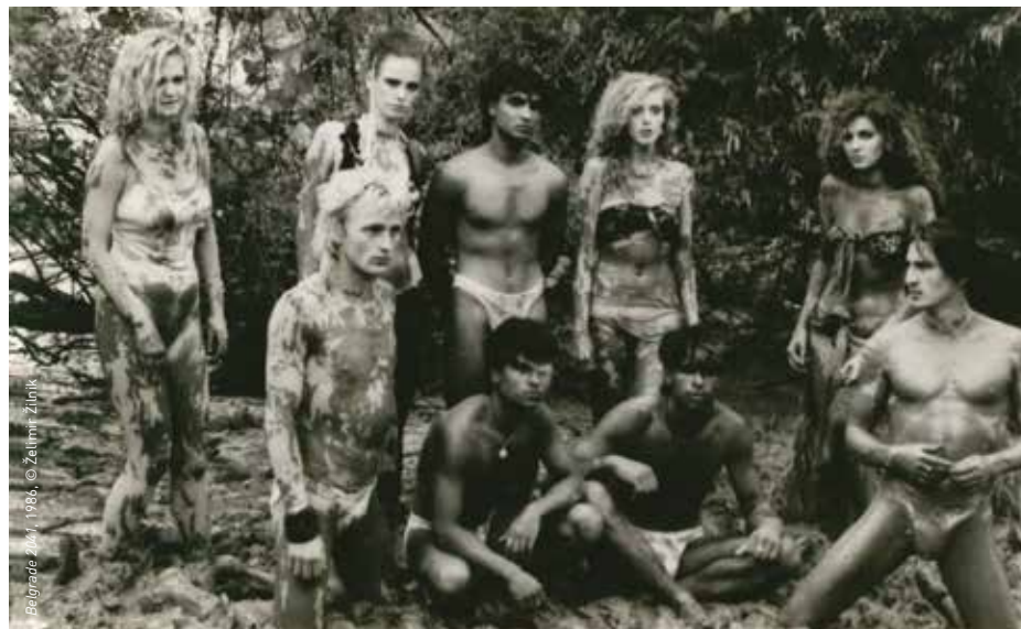
Belgrade 2041, 1986, © Želimir Žilnik

VENDREDI 19 AVRIL, 20H, PETITE SALLE, en présence de Želimir Žilnik SAMEDI 27 AVRIL, 20H, CINÉMA 2