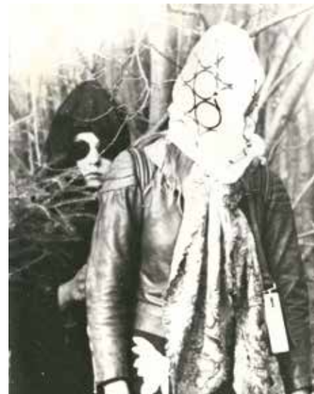
Le Paradis. Une tragi-comédie impérialiste, 1975, © Želimir Žilnik Ewa Mazierska, Images n°22, 2013

En communiquant tant de choses en si peu de temps, en utilisant si peu de ressources financières et en signalant clairement sa présence sans perdre de vue les questions politiques en jeu, Žilnik répond parfaitement à l'idéal non formulé du cinéma indépendant : l'auteur, la miniature et l'engagement politique, et comble le fossé entre les cinémas indépendants de l'Est et de l'Ouest.