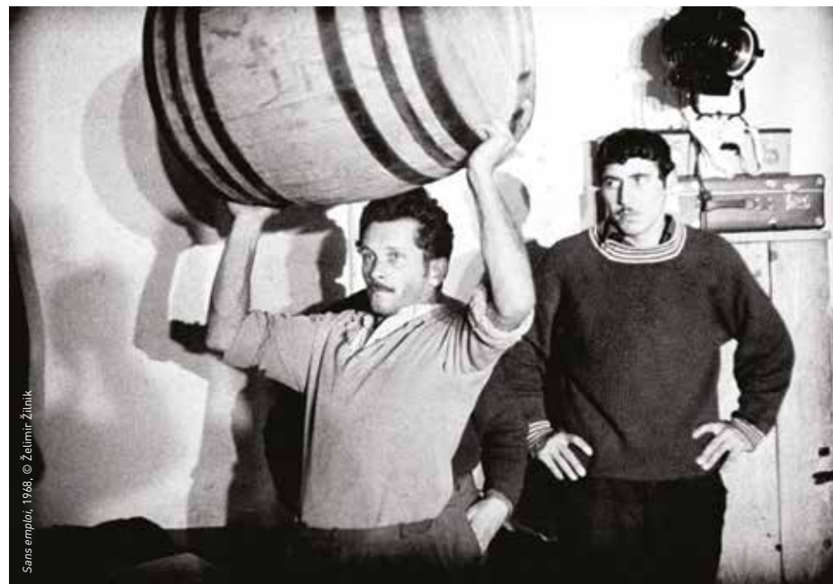
Sans emploi , 1968, © Želimir Žilnik

Si le titre évoque l'enfant pionnier de l'idéologie officielle, dès la séquence d'ouverture le film développe une autre image en contrepoint vis-à-vis de ces enfants marginaux : celle d'une émission télé où des gosses rient de bonheur devant le spectacle d'un acteur populaire (« Gula »). C'est sans doute un renvoi au décalage entre l'image véhiculée par l'idéologie d'une part et une réalité sociale de l'autre. Cette dernière est constituée d'une jeunesse qui n'est pas intégrée dans la vision officielle, tout comme elle ne l'est pas dans la société yougoslave. D'ailleurs, approchée sans misérabilisme, elle vit ses propres plaisirs à la marge.