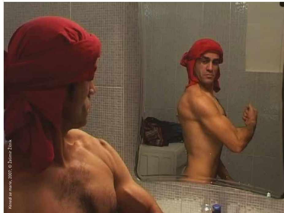
Kenedi se marie, 2007

DIMANCHE 21 AVRIL, 17H, CINÉMA 1 SAMEDI 4 MAI, 20H, CINÉMA 1