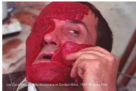
Les Corneilles, Ljubiša Kozomara et Gordan Mihić, 1969, © Avala Film

Le seul film réalisé par le duo de scénaristes de la nouvelle vague yougoslave, Ljubiša Kozomara et Gordan Mihić.