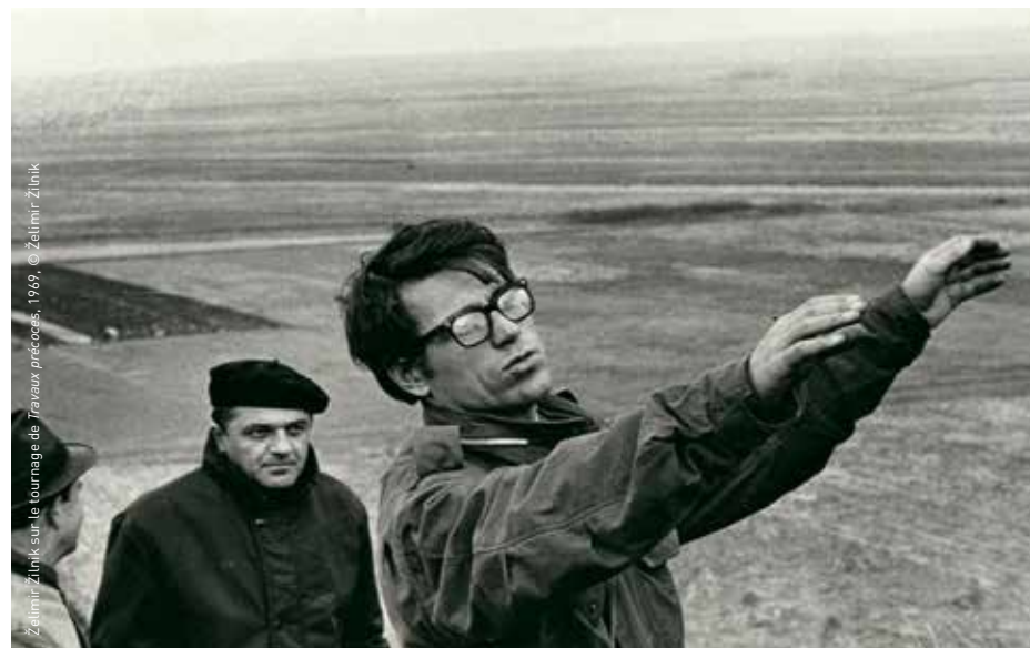
Željimir Žilnik sur le tournage de Travaux précoces , 1969.

Žilnik 1 est un jeune intellectuel, cinéphile, communiste et auteur d'un chef-d'œuvre moderniste Travaux précoces . Nous aurions pu en savoir plus sur lui si son deuxième long métrage, Liberté ou bande dessinée , n'avait été si violemment censuré par le gouvernement. Une fois la « Black Wave » ou Vague noire yougoslave interdite, l'Allemagne de l'Ouest a accueilli Žilnik 2, en tant que réfugié politique et animal de compagnie des festivals.