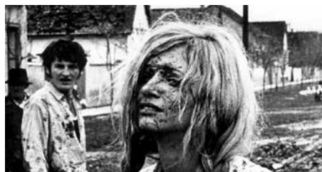
Travaux précoces, 1969, © Želimir Žilnik

Yougoslavie, 1969, 35mm, 87', nb, vostf scénario : Želimir Žilnik et Branko Vučićević / image : Karpo Acimović-Godina / son : Miodrag Petrović Šarlo / montage : Karpo Acimović-Godina / prod. : Avala Film, Neoplanta Film avec Milja Vujanović, Bogdan Tirnanić, Čedomir Radović, Marko Nikolić, Slobodan Aligrudić, Piroška Čapko Ours d'or à la Berlinale 1969