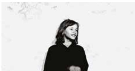
Les Petits Pionniers , 1968, © Želimir Žilnik