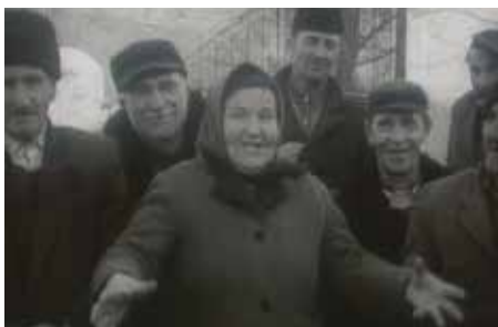
Soulèvement à Jazak, 1973, © Željimir Žilnik

scénario : Željimir Žilnik, Branko Vučićević / image : Dušan Ninkov / son : Bogdan Tirnanić, Branko Vučićević / montage : Miodrag Petrović Šarlo / prod. : Neoplanta Film avec Dragoljub Mićunović, Dragoljub Vojnov, Stevo Žigon Mention spéciale au festival d'Oberhausen 1969