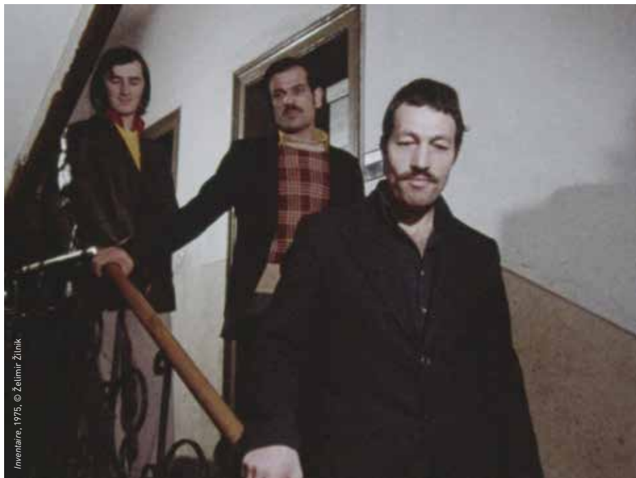
Inventaire, 1975, © Želimir Žilnik

LUNDI 15 AVRIL, 20H, CINÉMA 2, en présence de Želimir Žilnik SAMEDI 27 AVRIL, 17H, CINÉMA 2