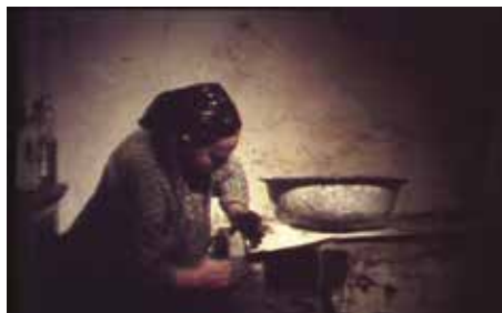
Sept Ballades hongroises, 1978, © Želimir Žilnik

LUNDI 22 AVRIL, 17H, CINÉMA 1 DIMANCHE 28 AVRIL, 17H, CINÉMA 2