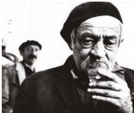
Black Film, 1971. © Želimir Žilnik