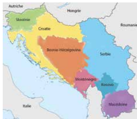
Carte des républiques qui composaient la Yougoslavie

Critique et historien du cinéma, programmateur et directeur artistique du festival Spirit of Fire