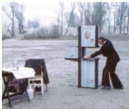
Peuple de foire, 1977. © Želimir Žilnik

dont un passage dit : « Je dois lutter contre deux ennemis : ma propre nature bourgeoise qui fait de cet engagement un alibi et un commerce, et ceux au pouvoir à qui le silence profite ». Lors de la présentation de Black Film au festival du documentaire et du court métrage yougoslave de Belgrade en mars 1971, le réalisateur a lu à haute voix un autre manifeste qu'il avait écrit pour l'occasion (intitulé de manière provocante « Ce festival est un cimetière ») dans lequel il dénonçait les « films socialement engagés » qui cherchaient « le plus pittoresque des misérables qui serait prêt à souffrir de manière convaincante devant la caméra ». Celluloid Liberation Front, Cinema Scope n°65, mars 2016