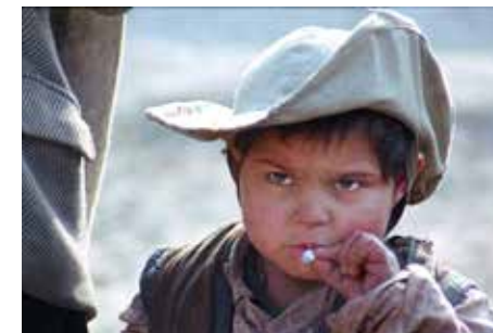
J'ai même rencontré des Tziganes heureux, Aleksandar Petrović, 1967, © Malavida

JEUDI 2 MAI, 20H, CINÉMA 2 JEUDI 9 MAI, 20H, CINÉMA 2