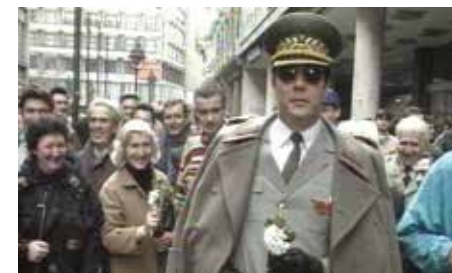
Tito de retour parmi les Serbes, 1994, © Željimir Žilnik

Le film documente les quatre premiers jours de manifestations, leur charge politique et critique, mais aussi leur esprit carnavalesque. Monté dans la foulée, comme un ciné-tract, il a été projeté dès le septième jour du mouvement.