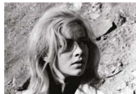
L'homme n'est pas un oiseau, Dušan Makavejev, 1965, © Avala Film

Premier long métrage de Dušan Makavejev, l'une des principales figures de la « Black Wave » yougoslave, le film marque autant par le réalisme de sa description d'une ville industrielle et d'une jeunesse sans perspectives que par son féminisme, dénonçant notamment l'exploitation sexuelle des femmes.