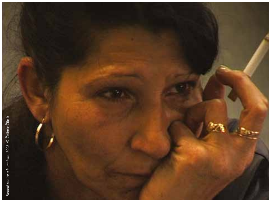
Kenedi rentre à la maison, 2003, © Želimir Žilnik

SAMEDI 13 AVRIL, 15H, CINÉMA 2, en présence de Želimir Žilnik SAMEDI 4 MAI, 17H, CINÉMA 1