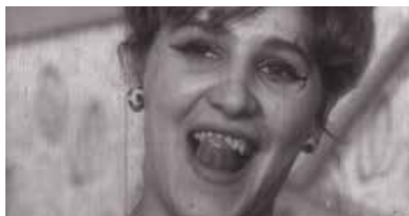
Journal de jeunes villageois en hiver , 1967, © Želimir Žilnik

DIMANCHE 14 AVRIL, 15H, CINÉMA 2, en présence de Želimir Žilnik SAMEDI 11 MAI, 17H, CINÉMA 2