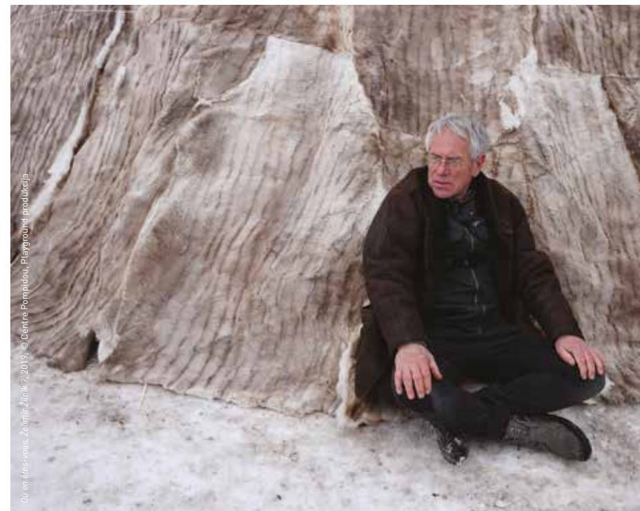
Où en êtes-vous, Želimir Žilnik ? 2019